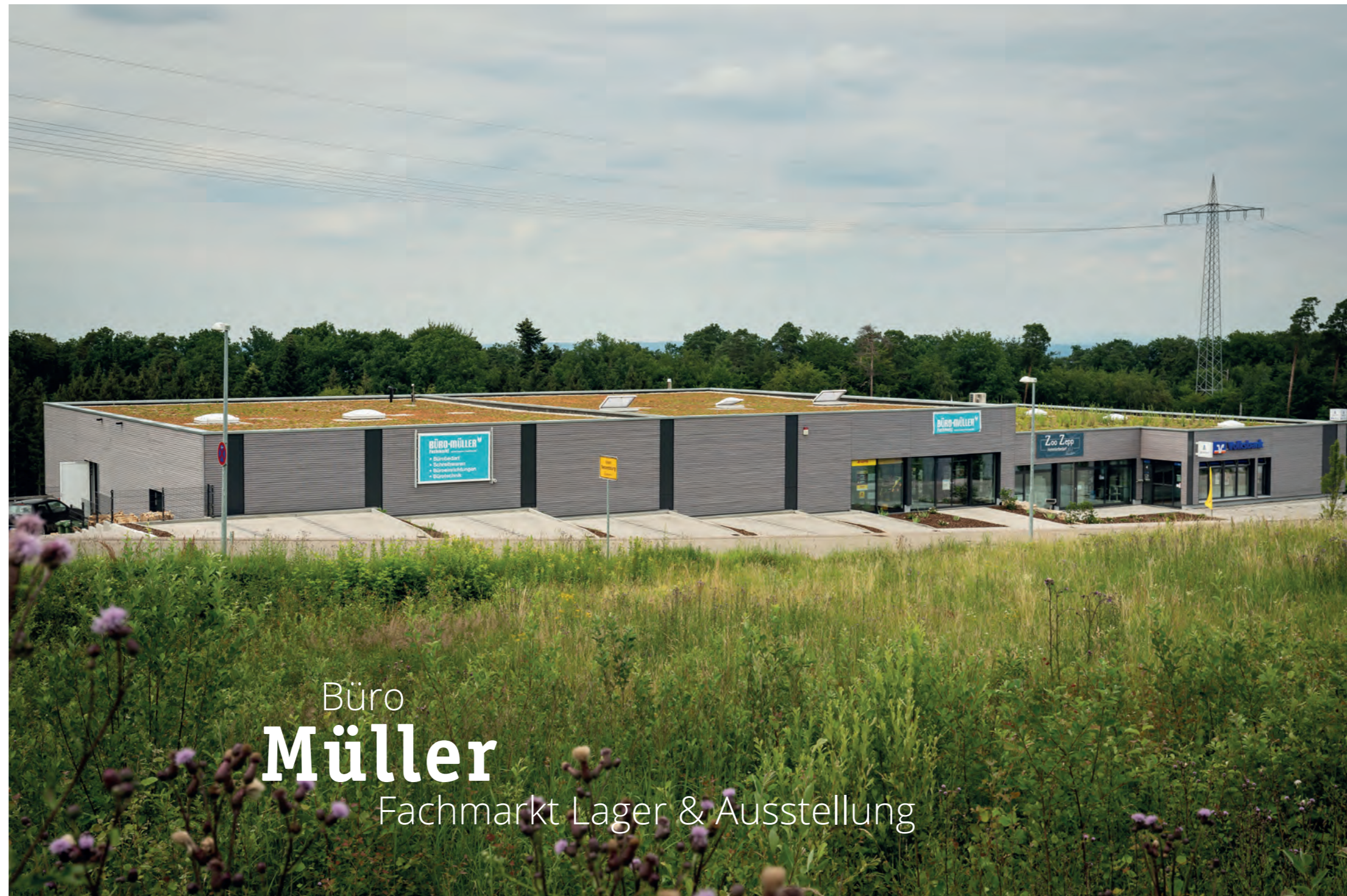
Büro Müller Fachmarkt Lager & Ausstellung